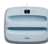
Cricut EasyPress 3 Large