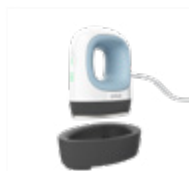
Cricut EasyPress Mini

Med jämn värme från kant-till-kant, enkla kontroller och smarta säkerhetsfunktioner gör Cricut EasyPress alla värmeöverföringsprojekt till en lätt match.