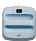
Cricut EasyPress 3 Keskitaso