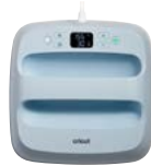
Cricut EasyPress 3 Medium