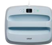
Cricut EasyPress 3 Large