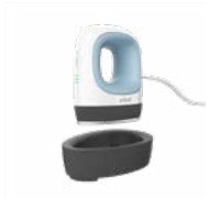
Cricut EasyPress Mini

Met een gelijkmatige warmte van rand tot rand, een eenvoudige bediening en slimme veiligheidsfuncties, maakt Cricut EasyPress van elk project met warmteoverdracht een fluitje van een cent.