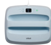
Cricut EasyPress 3 Large