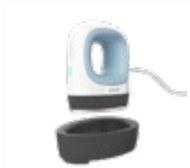
Cricut EasyPress Mini

Cricut EasyPress -sarjan laitteiden tasaisen lämmönjakautumisen, helpokäyttöisten säädinten ja älykkäiden turvaominaisuuksien ansiosta voit toteuttaa minkä tahansa lämpösiirtoprojektin helposti.