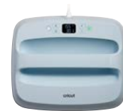
Cricut EasyPress 3 Groß