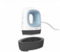
Cricut EasyPress Mini

Schnelles und unkompliziertes Aubügeln für langanhaltende Ergebnisse! Mit gleichmäßiger Wärmeübertragung von Kante zu Kante. Einfache Bedienung und smarte Sicherheitsfunktionen. Die Cricut EasyPress™ macht es leicht, jedes Wärmeübertragungsprojekt in Angriff zu nehmen.