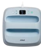
Cricut EasyPress 3 Medium