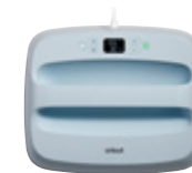
Cricut EasyPress 3 Stor