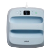
Cricut EasyPress 3 Medium