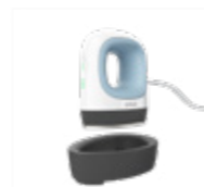
Cricut EasyPress Mini

Med jævn varme fra kant til kant, enkel betjening og smarte sikkerhedsfunktioner gør Cricut EasyPress ethvert varmeoverførselsprojekt til en leg.